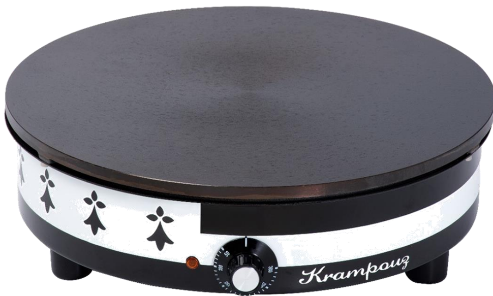
Gwenn Ha Du CEBED4