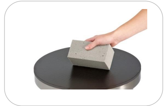
Pierre abrasive Abrasive stone APA1