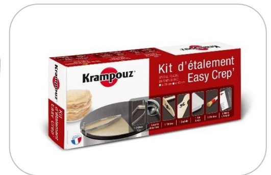
Kit d'étalement Spreader kit AKE84