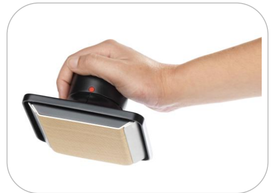
Tampon de graissage, d'essuyage et d'essuyage ATE1 Cleaning pad for seasoning, greasing and wiping crepe makers ATE1