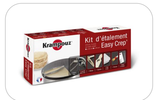
Kit d'étalement AKE84 Spreader kit AKE84