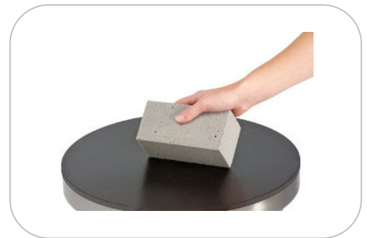
Pierre abrasive APA1 Abrasive Stone APA1