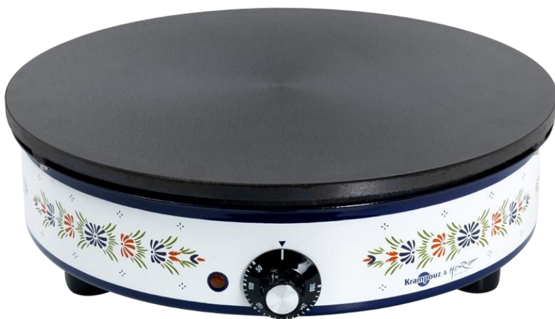
Crêpière Krampouz & Henriot-Quimper CEBEE4 Crepe maker Krampouz & Henriot-Quimper CEBEE4