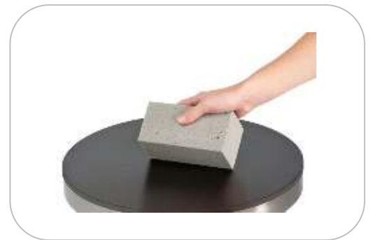
Pierre abrasive APA1 Abrasive Stone APA1