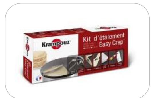
Kit d'étalement AKE84 Spreader kit AKE84