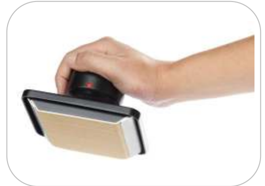
Tampon de graissage, d'essuyage et d'essuyage ATE1 Cleaning pad for seasoning, greasing and wiping crepe makers ATE1