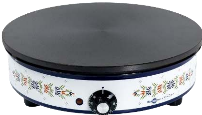
Crêpière Krampouz & Henriot-Quimper CEBEE4 Crepe maker Krampouz & Henriot-Quimper CEBEE4