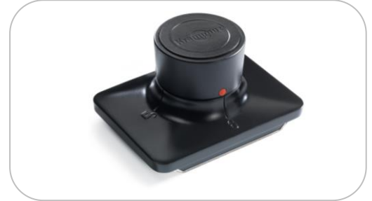
Tampon de culottage, de graissage & d'essuyage Cleaning pad and spare felts