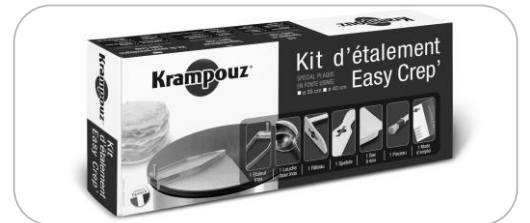
Kit d'étalement AKE84 Spreader kit