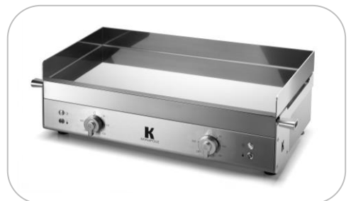
Planchas électriques et gaz Electric and gas planchas