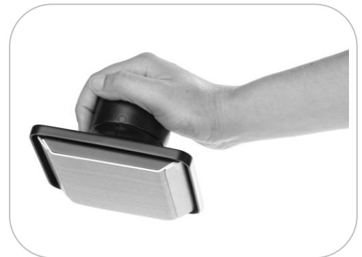
Tampon de graissage, d'essuyage et d'essuyage Cleaning pad for seasoning, greasing and wiping crepe makers ATE1