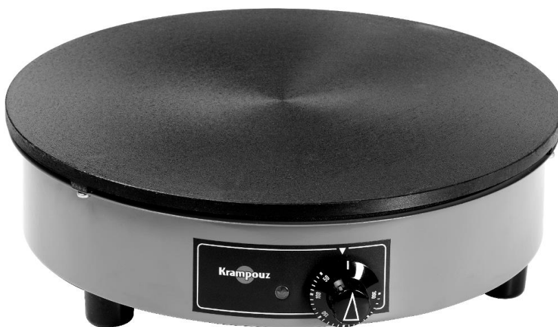
« La Billig »