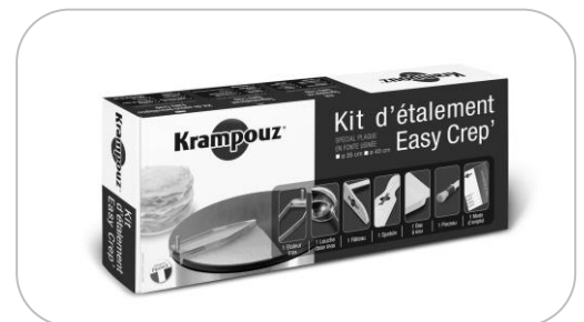
Kit d'étalement Spreader kit AKE84